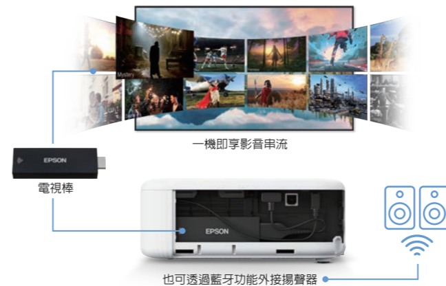
一機即享影音串流