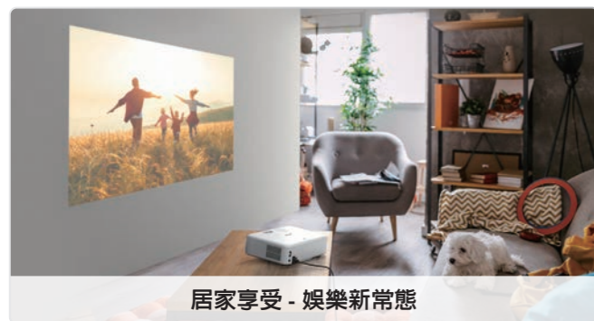
居家享受 - 娛樂新常態