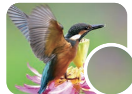
3LCD 投影機: 色彩漸層平順的畫質