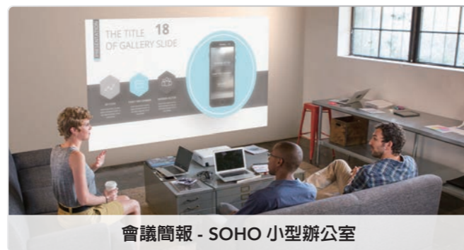
會議簡報 - SOHO 小型辦公室

3000lm 1080p 白色/彩色亮度 解析度 5W 環繞喇叭 電視棒 *內置 Android TV