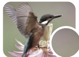
色彩漸層模糊的畫質